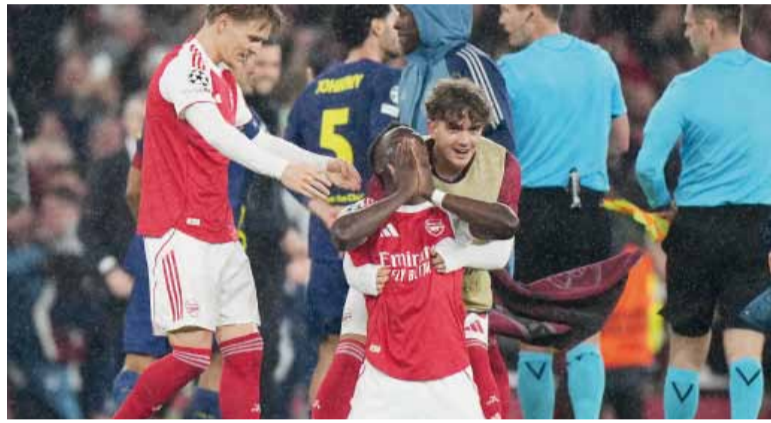
Segunda final. Los ingleses disputarán una definición veinte años después de la caída ante Barcelona.

El partido respondió a lo que prometía la previa. Hubo más cautela que vértigo, más tensión que fluidez. Ambos equipos entendieron que una equivocación podía