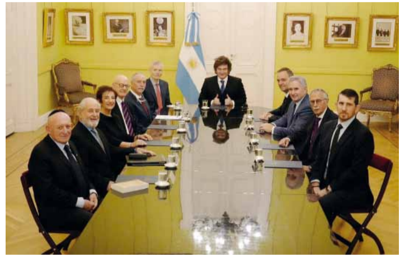
A su lado. Javier Milei y Manuel Adorni, ayer, en Casa Rosada.