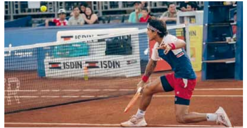
Avanzó. El bonaerense superó al suizo Leandro Riedi, por 6-4, 2-6 y 6-4, en dos horas y dos minutos de juego.

El tenista marplatense logró superar la qualy y se convirtió en el décimo argentino que competirá en el Foro Itálico.