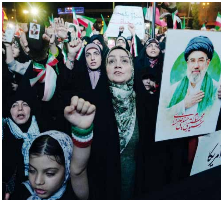
Frágil. Aunque la tregua formal sigue vigente, persisten los cruces diplomáticos y militares.

La decisión iraní llegó después de la reciente ofensiva militar conjunta de Estados Unidos e Israel contra objetivos en territorio iraní. Desde entonces, la región atraviesa una etapa de tensión permanente. Aunque el 8 de abril se anunció una tregua, en los días posteriores continuaron los ataques con misiles y drones lanzados por Teherán contra