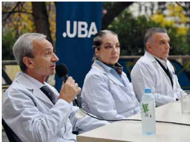
En las calles. Los directores médicos reclamaron por la aplicación de la Ley de Financiamiento 27.795. - Página/12 -

Asimismo, Lafos señaló que en los hospitales tienen que "recorrer a todo tipo de ingeniería", entre lo