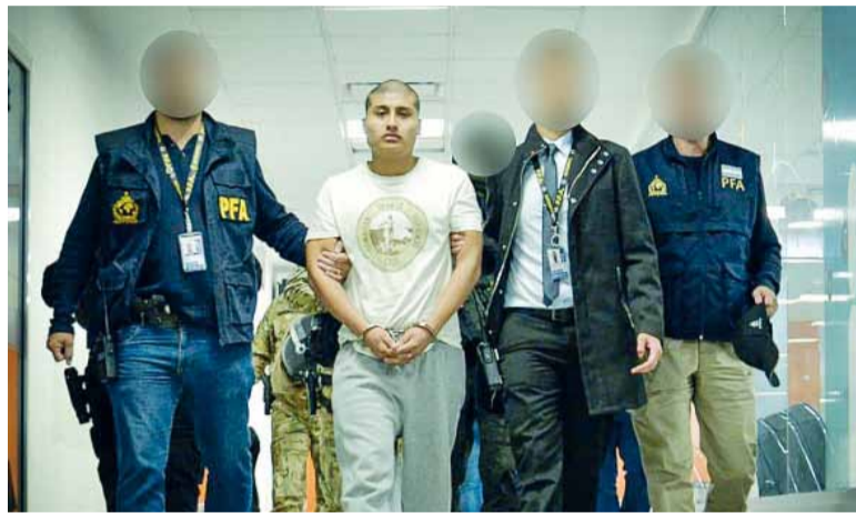
Declaración. El acusado negó haber contratado sicarios.

En la causa hay otras 11 personas imputadas por el juez Rodrí-