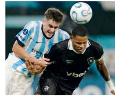
La Academia se juega hoy una gran chance.

Racing visitará hoy a Botafogo de Brasil, por la cuarta fecha del Grupo E de la Copa Sudamericana, en busca de un triunfo clave que le permita meterse en la pelea por el liderazgo.