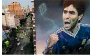
Juicio. Diego Maradona falleció el 25 de noviembre de 2020.